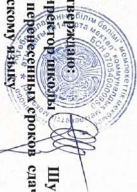
График (дополнительно контролю по казахскому языку проведения промежуточного контроля по казахскому языку в классах с казахским языком обучения и казахскому языку и литературе в классах с русским языком обучения в 2023-2024 учебном году.